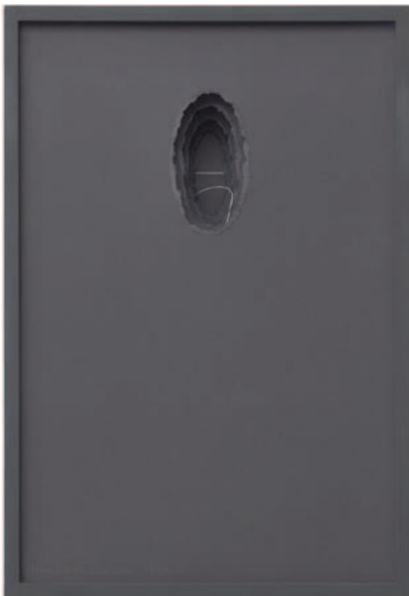
Linha Solta, da série Desenho Objeto, 1975.

Papéis e linha de costura em caixa de madeira com vidro 55 x 38 x 14cm.