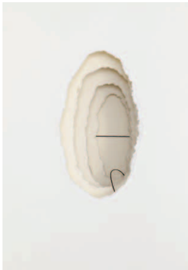
Linha Solta, da série Desenho Objeto, 1975.

Papéis e linha de costura em caixa de madeira com vidro 55 x 38 x 14cm.