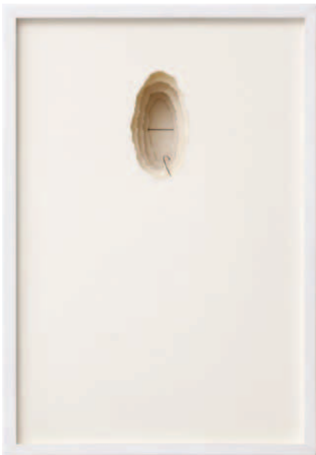
Linha Solta, da série Desenho Objeto, 1975.

Papéis e linha de costura em caixa de madeira com vidro 55 x 38 x 14cm.