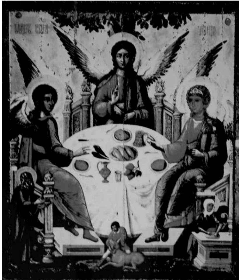
Cristo Alado Anônimo, s/d

imagens artificiais e o véu do interdito bíblico, que cobre a imagem do Deus hebreu, pôde se tornar um plano de inscrição da face do homem cristão. Cristo seria nomeado pela palavra grega prosopon , isto é, pessoa vista frontalmente. Em um belo insight , Mondzain revela-nos o duplo sentido do termo prosopopeia : dá-se rosto à pessoa e faz-se falar o que não possui rosto ou fonação 7 . O Verbo encarnado oferece o modelo de uma “imagem falante,” contramodelo dos ídolos enganadores e falaciosos. Entretanto, se as imagens nos falam, não é para