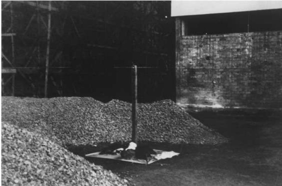
Fig. 3 - Cildo Meireles, Tiradentes – Totem Monumento ao Preso Político , 1970.