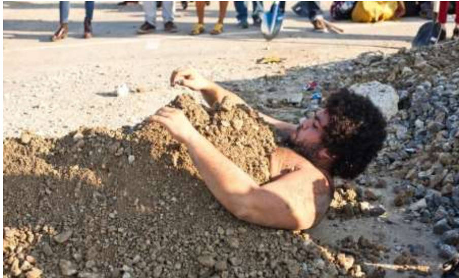
Fig. 5 - Jota Mombaça, Soterramento , 2016.