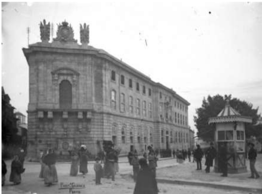
Fig. 1 - Fachada da Cadeia da Relação, cerca de 1900.