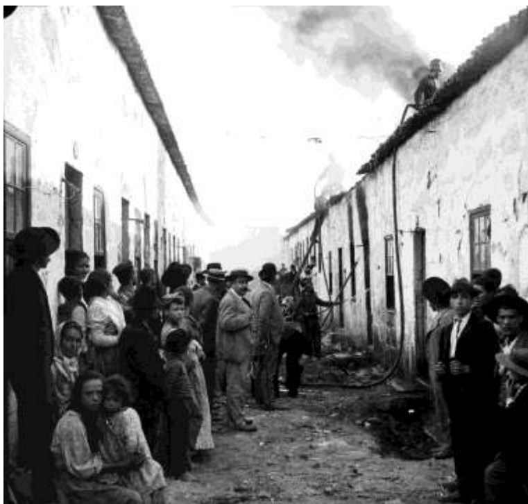
Fig. 3 - Bombeiros em combate sanitário à peste bubônica nas Ilhas do Porto, 1899.