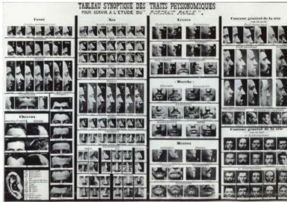
Fig. 2 - Alphonse Bertillon, Tableau synoptique des traits physionomiques , 1909. gelatina de prata, 20 x 29cm