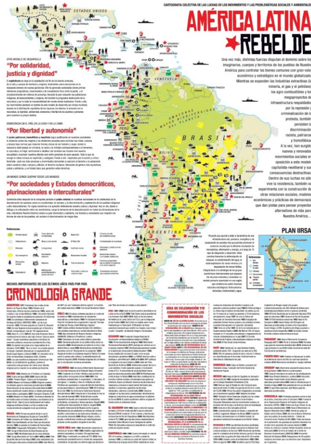
Fig. 4 – Iconoclastas, América Latina Rebelde , 2010. medidas y soportes variables