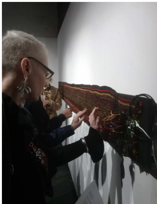
Fig. 4 - aruma | Sandra De Berduccy, e-sirinu Tejido interactivo de sonido programable https://sandradeberduccy.com/proyectos-2/e-sirinus/away-0-2/

Y ahí siempre es importante hablar sobre la continuidad de estas técnicas en función de un pensamiento particular y diferenciado, y que no necesariamente la tecnología es dura como en las computadoras, sino que puede ser blanda, suave. Y a esta conclusión se puede llegar a través de la investigación en arte.