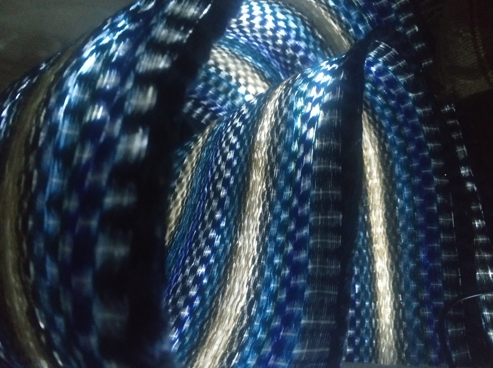
Fig.2 - aruma | Sandra De Berduccy, Op/Tar , 2017 Tejido tradicional, lana, fibra óptica y componentes eléctricos, 174 x 43 cm https://sandradeberduccy.com/proyectos-2/e-aruma/op-tar/