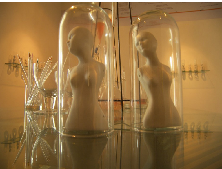
Fig. 1 José Henrique Barreto - Sem título.

Os laboratórios de química e genética me deram subsídios para incorporar elementos de expressão, como a transparência e a assepsia. Se na prática da medicina trabalho em ambiente estéril, dentro do meu universo artístico acontece a “contaminação” no trato com a matéria e na negação da lógica e da funcionalidade. Já criei instalações com objetos “organizadamente desarrumados”: tubos de ensaio, copos de Becker, Erlenmeyers, frascos Kitazato, provetas, balões volumétricos e com saída lateral, trompas de vácuo,