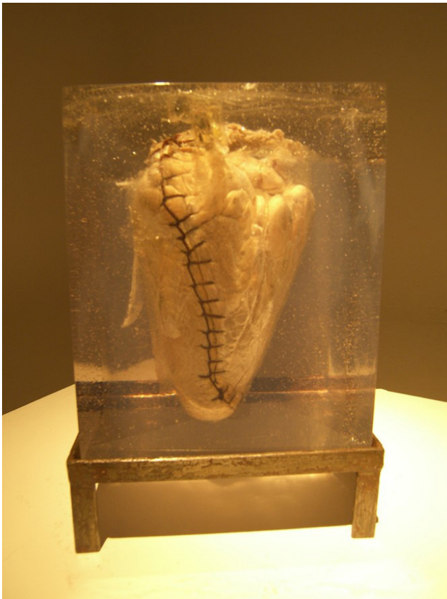
Fig. 4 José Henrique Barreto - Sem título. Fotografia do autor

pela abordagem médica, bordei em sutura cirúrgica contínua na face externa das suas câmaras cardíacas um caminho que vai da base ao ápice e simboliza o fio que nos conduz à vida.