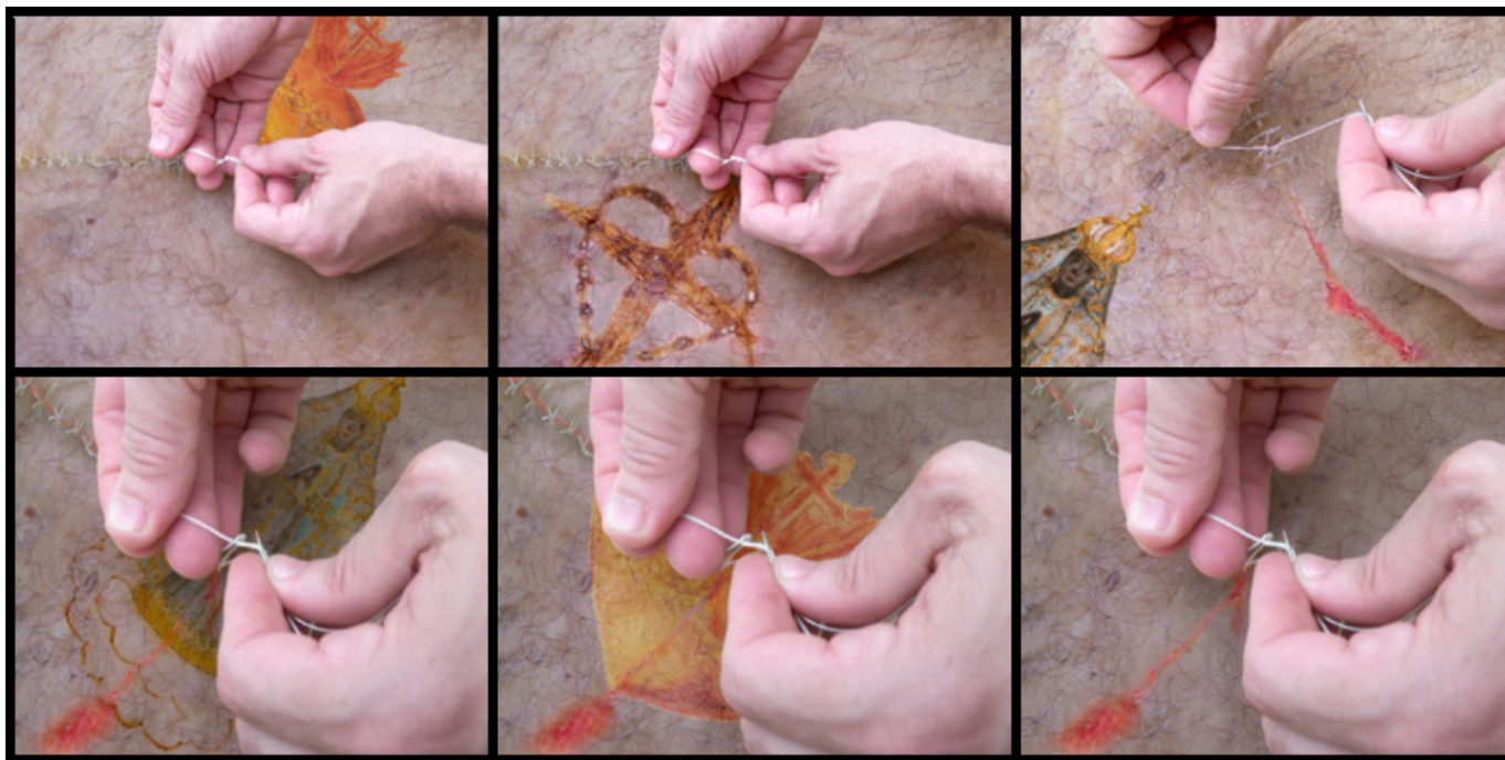
Fig. 3 José Henrique Barreto. Corpo Santo

Adentrando por outra seara, tenho pensado na visceralidade. Entendo que a visceralidade constitui uma dimensão corporal que é por natureza recessiva e ausente, que foge de minha percepção direta e que, no entanto, é constitutiva da corporeidade. Um coração bovino, salgado, desidratado, lavado, inserido em um bloco de resina de poliéster cristal, transparente, deixa perceber parte do corpo, que é sentida pelo seu ritmo e dor; sabemos que o órgão existe através dos seus mecanismos de funcionamento (Fig. 4). Para dar um tratamento pessoal, diferente daquele imposto