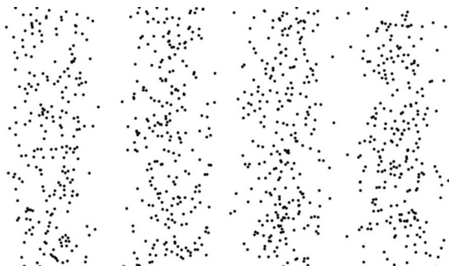
Fig. 2 Por Thierry Dugnonle: experimento da dupla fenda: enviando partículas individuais.

fendas, eles colidem e a colisão os faz desviar, fazendo com que atinjam um ponto diferente da parede. Deutsch (1996) destaca que tal explicação é, no entanto, falsa, o que é demonstrável se emitirmos um fóton de cada vez no experimento. Se fosse verdade que os fótons colidem entre si, enviar um único fóton de cada vez deveria ser suficiente para evitar que a colisão acontecesse. Apesar disso, ao conduzir o experimento dessa maneira, o padrão das sombras projetadas é exatamente o mesmo. À medida que se envia um fóton de cada vez, um padrão - caótico e incoerente a princípio - é gradualmente formado até o momento em que revela exatamente a mesma imagem produzida por todo um feixe de luz. Daí a questão é colocada mais uma vez: se um único fóton aleatório passa pelas fendas, o que explica esse padrão de brilho, sombra e penumbra no final depois que muitos fótons foram enviados? Como podemos dizer que os fótons colidem uns com os outros? Como podemos dizer que um único fóton se comporta como se fosse uma onda, uma vez que testemunhamos claramente