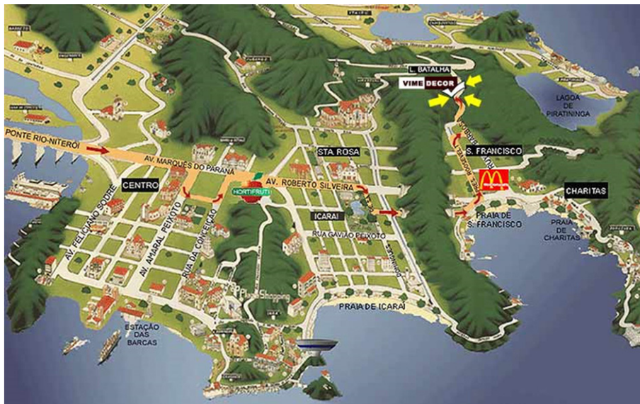
Véase en el inferior al centro la ilustración del MAC, ubicado en un mirador en el barrio Boa Viagem

He estado investigando la ciudad de Niterói, en especial sus valores culturales y patrimoniales, y es muy evidente la asunción del significado del MAC en el imaginario niteroiense. Busco entender el hecho urbano como resultado de la producción de diversos actores sociales, cuyas ambigüedades y fantasías deben ser reveladas. Y, también, destacar que las expectativas de los usuarios de las ciudades son construidas culturalmente, pero que son, también, representaciones inducidas ideológicamente. Los estudios sobre titulares y artículos de periódicos pueden ser bastante representativos del poder que tienen de los discursos en la constitución de imaginarios. Veámos ejemplos de titulares de prensa extraídos del dominical del periódico O Globo (separata Niterói ).