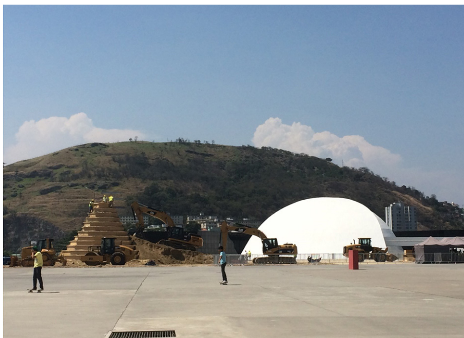
Construcción del Castelo de Areia en el Camino Niemeyer 02/11/14 – Acervo propio de la investigación.

Fluminense”, o castelo iria ser inaugurado no dia 12/11/2014, uma quarta-feira, e a visita seria até o dia 22 do mesmo mês xii . O feito deveria atrair público e divulgar o Caminho, assim como a cidade de Niterói, mas quem chegou lá do dia 12 só conseguiu ver o castelo desmontado, pois no dia anterior foi realizada a medição oficial para análise e logo em seguida a escultura foi derrubada. (RODRIGUES ; SILVA, 2014b)