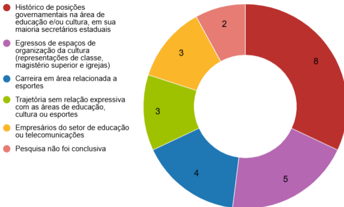
Figura 2 – Os 25 deputados constituintes da Subcomissão organizados de acordo com sua relação anterior com as áreas de Educação, Cultura e Esportes