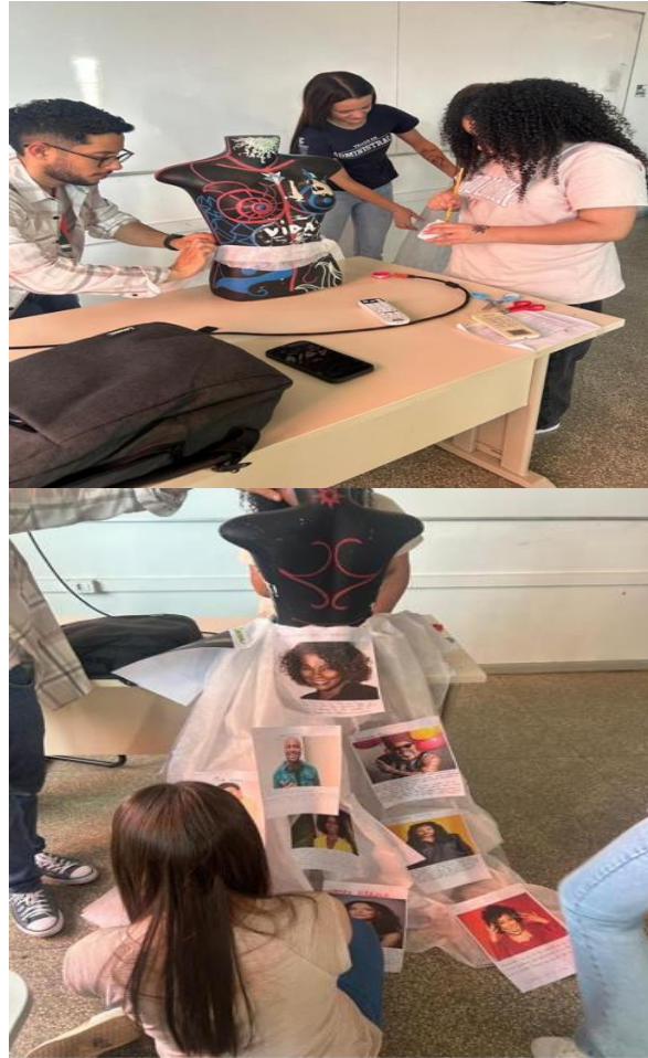
Figura 3 e 4: Produção do material para exposição.