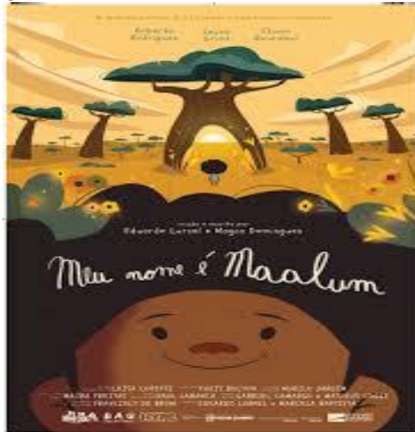
Figura 2: Cartaz do filme Meu nome é Maalum (2021).