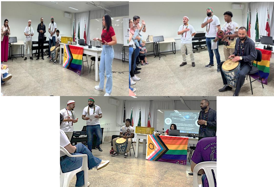
Figura 1, 2 e 3: Fragmentos da atividade com religiões de matriz africana no IFRS, campus Vacaria.

O banho de ervas também é rito essencial para limpeza, equilíbrio espiritual e proteção, cada erva possui propriedades específicas. Aqui acontece a convergência dos saberes ancestrais, indígenas e do campo. As ervas tanto no banho como na defumação são advindas das sabedorias destas três matrizes presentes no estado do Rio Grande do Sul, os povos africanos, indígenas e o gaúcho do campo, da medicina tradicional, acrescentando ervas próprias da região.