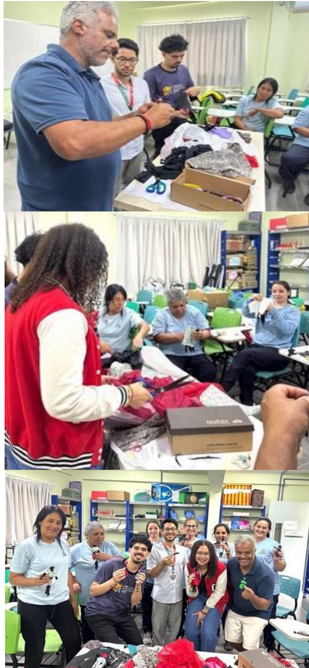
Figura 4, 5 e 6: Fragmentos da oficina.

raramente é tornado visível ou valorizado. A oficina, portanto, cumpriu um duplo objetivo: foi um veículo para a educação antirracista e, simultaneamente, um dispositivo de visibilização e valorização do trabalho de cuidado. Ao entrelaçar a discussão racial com a discussão sobre o trabalho, a ação evidenciou a consubstancialidade das opressões (Hirata, 2014), mas também apontou para a potência da resistência e da criação em ambos os campos.