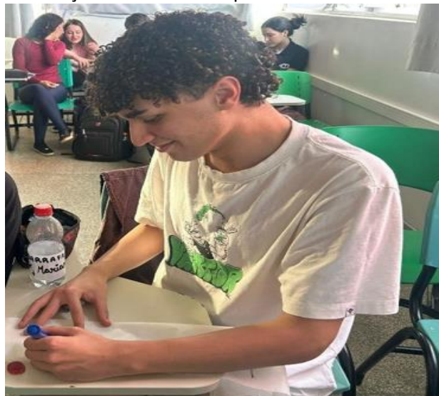
Figuras 5 e 6: Produção das faixas com palavras-chave sobre a cultura negra.

A escolha das palavras não foi aleatória: cada termo emergiu das discussões realizadas ao longo do projeto, refletindo o repertório construído coletivamente pela turma. A palavra "respeito", por exemplo, dialoga com o reconhecimento da diversidade étnico-racial no ambiente escolar. Já o termo "luta" remete à perspectiva histórica da resistência negra no Brasil, que não se limitou ao período escravocrata, mas se reinventa cotidianamente nas periferias, nas universidades e nos espaços de produção cultural. Já "Igualdade" e "força" evocam o princípio de equidade racial, palavras compreendidas como construção dinâmica e afirmativa diante de processos históricos de invisibilização.