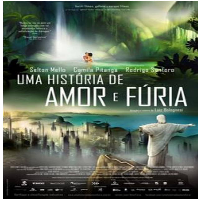
FIGURA 1: Cartaz do filme Amor e fúria (2013).