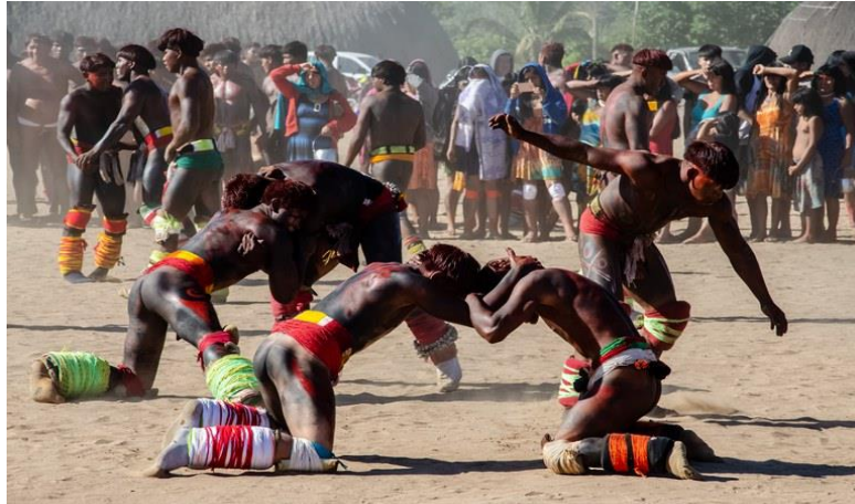
Figura 1: Luta Huka-huka.