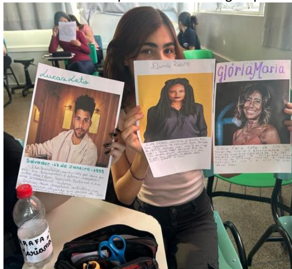
Figura 1 e 2: Escolha das personalidades negras pelos alunos.

A primeira etapa da atividade consistiu na apresentação de imagens e informações sobre diversas personalidades negras brasileiras do meio artístico. Esse momento teve como finalidade contextualizar a relevância histórica, cultural e social desses indivíduos, alinhando-se à perspectiva de Graebin (2019), para quem "a negritude, como afirmação de uma presença, e a literatura negra como atitude frente à atualidade da segregação, se apresentam como evidências incontestáveis" na contemporaneidade. A exposição das figuras permitiu que os alunos conhecessem artistas, escritores, músicos, atores, comunicadores e pensadores que contribuem de maneira significativa para o desenvolvimento da cultura afro-brasileira no país, promovendo o que Miranda (2024) define como "ambiente em que possam ser valorizadas as culturas e identidades negras brasileiras, desvinculadas de uma visão meramente assistencialista, focada em uma perspectiva de empoderamento". Além disso, essa etapa serviu como base para a escolha posterior das personalidades que seriam estudadas individualmente.