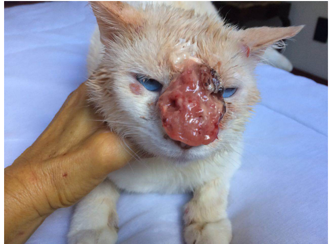
Figura 1: Lesão tumoral ulcerada em região nasal, lesões nodulares em regiões perioculares e auriculares em felino com esporotricose disseminada

O exame citopatológico coletado por imprint em lâmina de microscopia e a amostra corada pelo método panóptico rápido evidenciou estruturas fúngicas compatíveis com Sporothrix spp . A partir de coleta de exsudato da lesão ulcerada do plano nasal por meio de um swab estéril, foram realizados cultura fúngica e isolamento de Sporothrix spp . O isolamento do Sporothrix spp foi realizado em meio ágar Sabouraud dextrose e ágar Micosel a 25°C e em seguida o agente foi semeado em meio BHI a 37°C para a prova de dimorfismo térmico. Foi procedida a colheita de sangue total para realização de hemograma completo, bioquímica sérica (Alanina aminotransferase, Fosfatase Alcalina, Uréia e Creatinina) e teste rápido para detecção de anticorpos do FIV e antígenos do FeLV (ELISA, SNAP® Combo Plus, IDEXX). As alterações hematológicas foram discretas: anisocitose e policromasia, moderada presença de rouleaux eritrocitário, trombocitopenia e hiperproteinemia. A bioquímica renal e a hepática apresentavam-se dentro dos valores de normalidade e o teste rápido para detecção de anticorpos contra FIV e FELV mostrou resultado negativo.