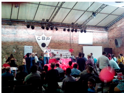
Acto de apoyo a la candidatura de Benedita da Silva para presidente del PT-RJ, Patio del SINTTEL, Río de Janeiro, sábado 28 de septiembre de 2013.