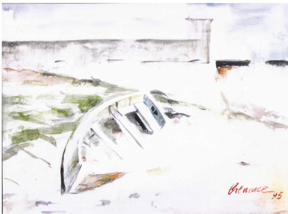
TELA 5 - HILÁRIO GEMUCE

Aguarela da Ilha de Moçambique, sem título, 1995.