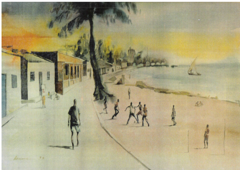
TELA 4 - HILÁRIO GEMUCE

Aguarela da Ilha de Moçambique, sem título, 1995.