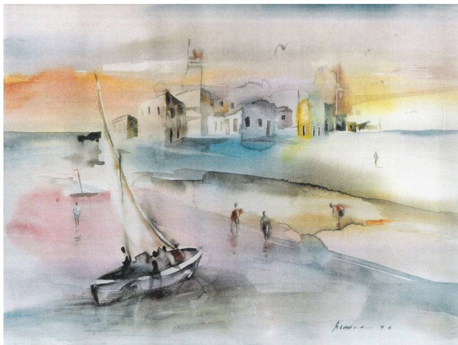
TELA 1 - HILÁRIO GEMUCE

Aguarela da Ilha de Moçambique, sem título, 1995.