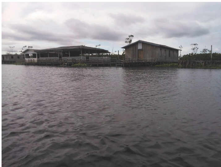
Figura 2: Sede da comunidade Ipiranga no período de cheia. Na foto, o rio Guajará em período de cheia, a casa de um morador, a cozinha, o barracão e igreja da comunidade cercadas de trapiche sobre palafitas