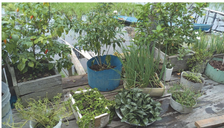
Figura 5: Diversidade de plantas cultivadas em canteiro suspenso pelas mulheres de Ipiranga

As mulheres de Ipiranga cultivam uma impressionante diversidade de plantas (Figura 5), que inclui desde temperos – cebolinha, coentro, alfavaca, pimenta-malagueta, tomate, pimenta cheirosa, pimentão e chicória – às ervas medicinais e aromáticas, como folha de alho, hortelãzinho, folhas de erva-doce, pião-roxo, gengibre, entre outras. Esse cultivo não se limita à variedade vegetal, mas revela um verdadeiro arsenal de saberes e técnicas ancestrais sobre manejo, preparo do solo e manutenção das espécies, garantindo sua sobrevivência mesmo em condições desafiadoras.