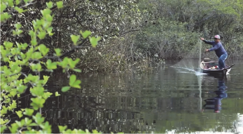
Figura 3: Mulher ribeirinha pescando de malhadeira, município de Barcelos (AM)