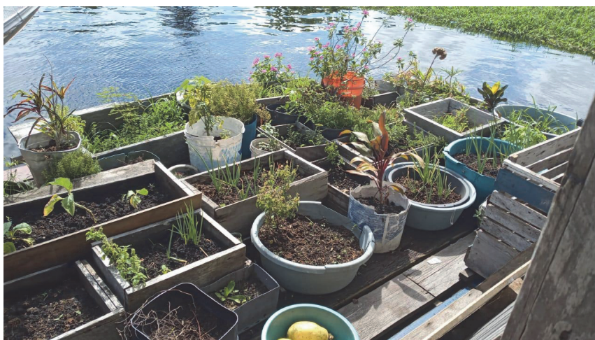
Figura 4: Canteiros suspensos preparados pelas mulheres da comunidade Ipiranga

Diante das inundações periódicas que caracterizam o ecossistema de várzea, as mulheres desenvolvem estratégias adaptativas para garantir a sobrevivência das plantas. Uma dessas práticas consiste na construção de canteiros suspensos sobre palafitas (estruturas de madeira elevadas) para que as plantas não sejam atingidas pela enchente das águas (Figura 4). Os canteiros suspensos são, em geral, construídos com materiais reaproveitados, como caixas de madeira, bacias, baldes, panelas e canoas em desuso. Essa técnica, socializada entre gerações, revela não apenas o conhecimento ambiental das mulheres, mas também sua capacidade criativa e inovadora, que agrega sustentabilidade e adaptação frente às dinâmicas naturais da várzea.