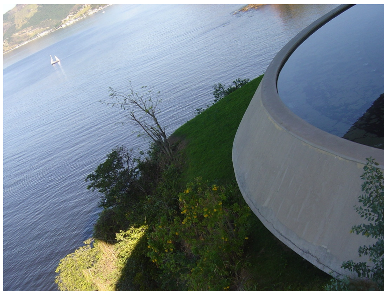
Espelhos d'água – Rejany Dominick