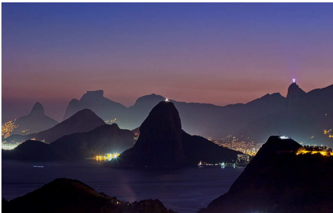
Vista do Parque da Cidade – Philippe Kling