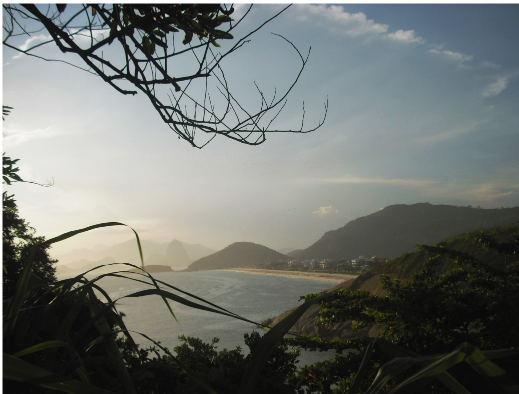
Olhando para Piratininga e para o mar da Praia do Sossego – Rejany Dominick