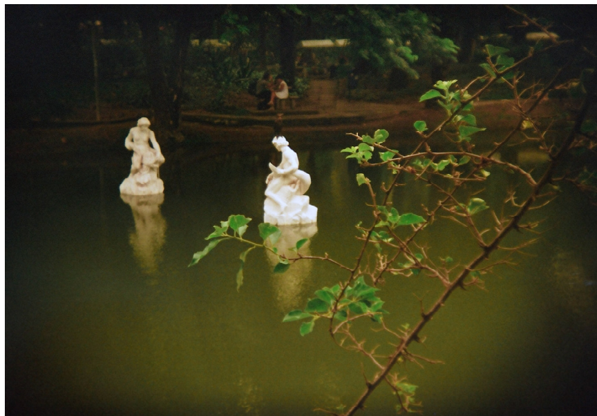
Esculturas do Lago, no Campo de São Bento – Gabi Dominick Garcia