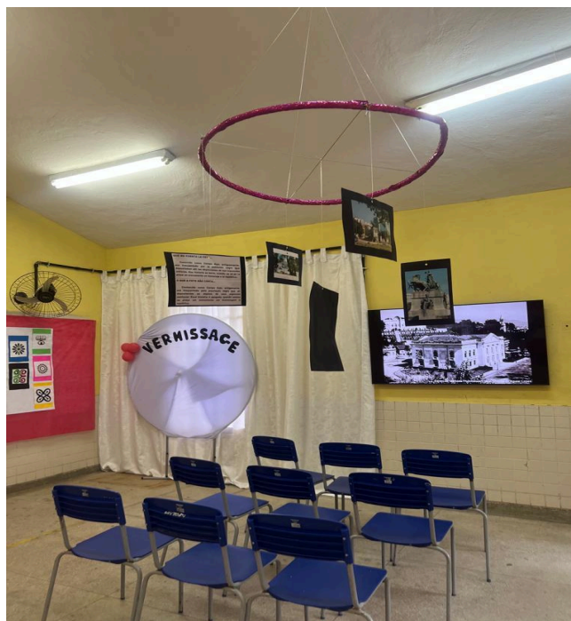
Foto 05 – Espaço reservado para exibição da produção audiovisual (Seção 04)