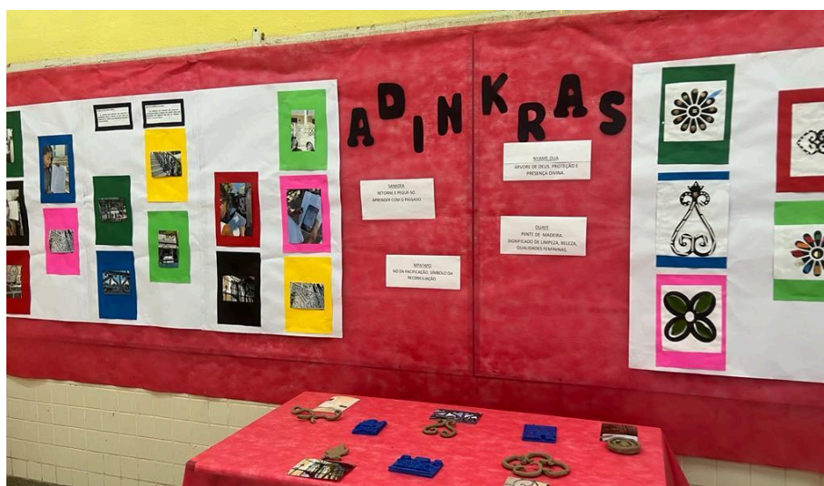
FOTO 04 - Fotografias impressas em 3D, alto relevo e modelagem em argila (Seção 03)