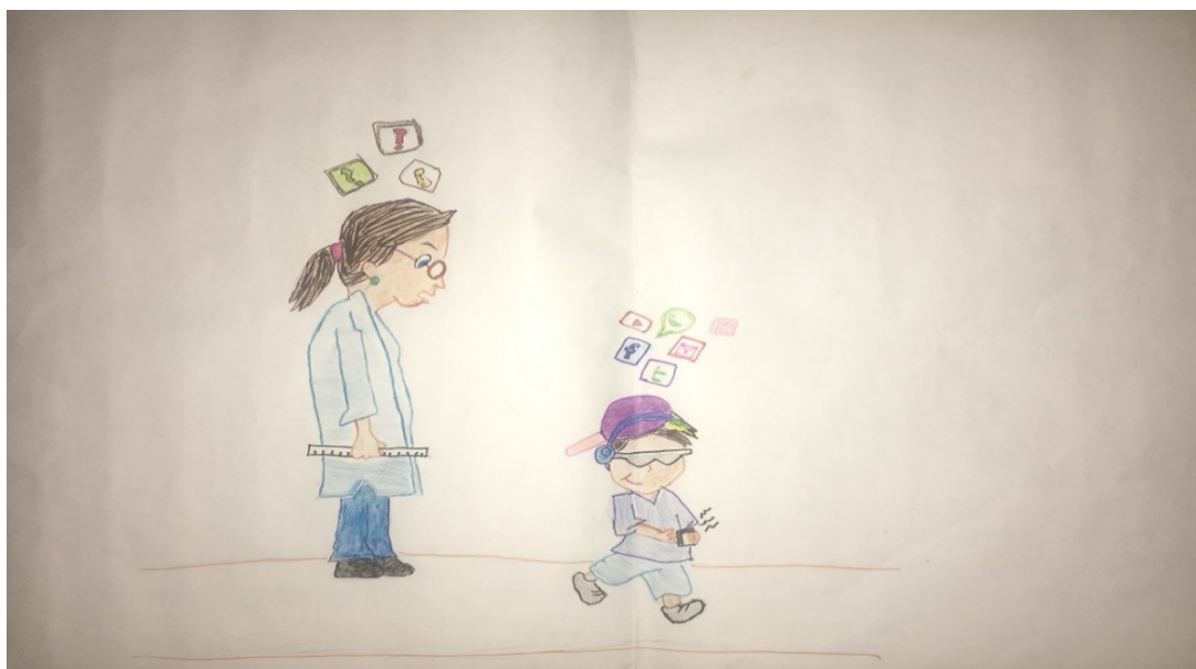
Figura 1-La escuela en Contemporaneity.

Coincidentemente, cada grupo se centró en uno de los aspectos citados, sin embargo, cuando la verbalización, también destacaron en sus declaraciones aspectos contened en las representaciones de otros grupos.