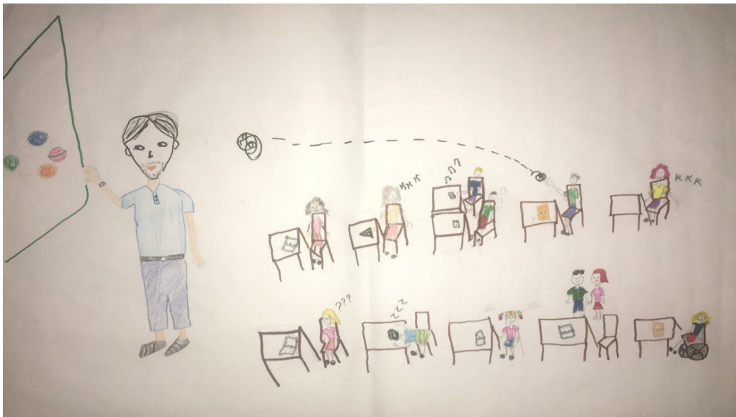
Figura 3-La escuela en Contemporaneity.