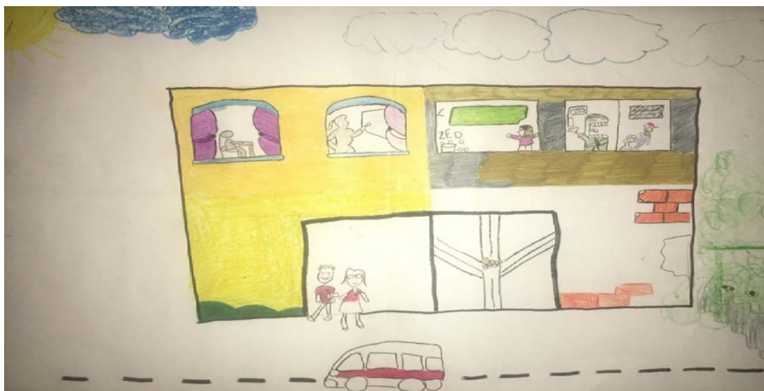
Figura 2-La escuela en Contemporaneity.