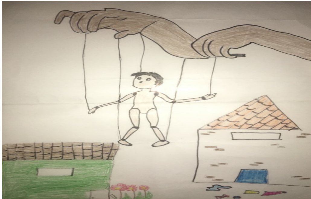
Figura 5-La escuela en Contemporaneity.

En cuanto a las respuestas no verbales formuladas por los cinco grupos del núcleo formativo 1C (turno de la tarde) sobre el interrogatorio realizado, tenemos el siguiente conjunto de representaciones: