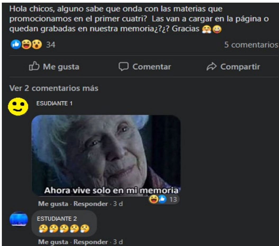
Fotografía 1: Posteo Facebook de Estudiantes, de 10/08/2020.

Se puede observar una presencia muy activa de las agrupaciones políticas, como el Centro de Estudiantes y otros movimientos políticos académicos, que forman parte de la vida universitaria interpelando a las diversas dimensiones, estructuras, y figuras de la misma, sino también aportando estrategias que tengan incidencia en la carrera, en los estudiantes, en los docentes, etc. 5