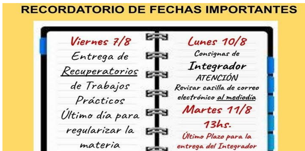
Fotografía 4: Posteo Facebook de Estudiantes, de 06/08/2020.

Visiblemente hay un uso de tipo académico, en relación o a partir de los intereses y/o necesidades vinculados a las asignaturas. Este uso, articula interacciones de los estudiantes, en relación a indagaciones sobre las propuestas formativas que, en algunos casos, incluyen recursos digitales para esta modalidad virtual como es el siguiente caso: “Buenas chicos.... ¿Alguien sabe el nombre de la aplicación de anatomía?” (Facebook de estudiantes, 2020), como interacciones en cuanto a la organización de la propuesta, como por ejemplo la siguiente imagen: