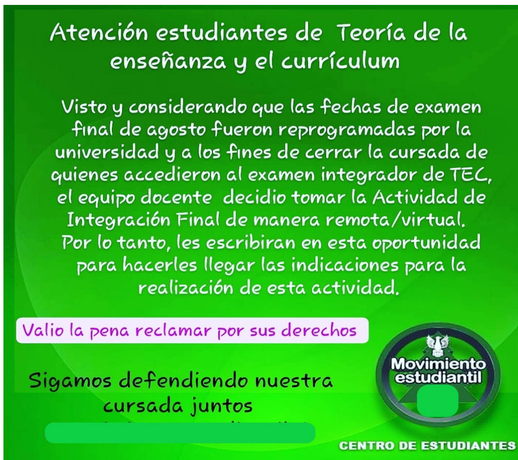
Fotografía 3: Posteo Facebook de Estudiantes, de 06/08/2020.

Las imágenes editadas como flyers de difusión, invitan a la acción concreta o a la participación en charlas y encuentros. A diferencia de los posteos a los que hicimos referencia, estas imágenes aparecen reiteradas veces en el muro, publicadas por diferentes personas, compartidas nuevamente dentro del grupo, generando una secuencia repetida de la misma información. Este tipo de posteos está más relacionado con las agrupaciones estudiantiles y movimientos políticos estudiantiles de variadas posiciones y perspectivas.