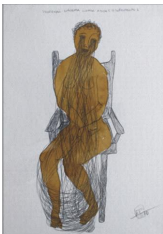
Figura 2 - Proteção extrema contra dor e o sofrimento. Grafite e aquarela sobre papel, 2011. Rosana Paulino.

que Foucault toma como alvo de seus estudos para compreender o fenômeno do poder, não chegaram a mobilizar verdadeiramente o pensamento e a arte ocidentais.