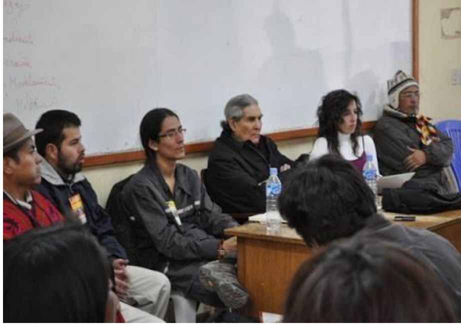
Anibal Quijano y líderes Kichwa, Mayas y Mohawk, en la IV Cumbre Continental de Pueblos Indígenas, Puno, 2009.

Insistió firmemente en la necesidad de superar el eurocentrismo, como el modo de recordar, pensar, interpretar y actuar, generado en 500 años de capitalismo, y del cual han bebido también las izquierdas, donde asimilamos de modo “natural” múltiples herencias de la modernidad/colonialidad, como son aquellas referidas a los mitos y las trampas del “desarrollo”, “partido”, “estado”, “democracia”, “domino de la naturaleza”, “patriarcado”; como enfoques predominantes de una racionalidad instrumental.