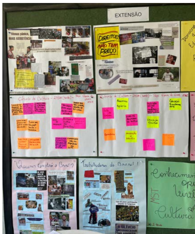
Figura 1. Mural destinado a socialização das atividades do Círculo de Cultura, ESS/UFF-Niterói

A mudança nas dinâmicas finais retirava os participantes do lugar-comum e da inércia, mobilizando o corpo, a arte, a criatividade e o diálogo. Isso produzia efeitos coletivos que eram expressos nos artefatos produzidos ao final na forma de materiais textuais, imagéticos ou artísticos.