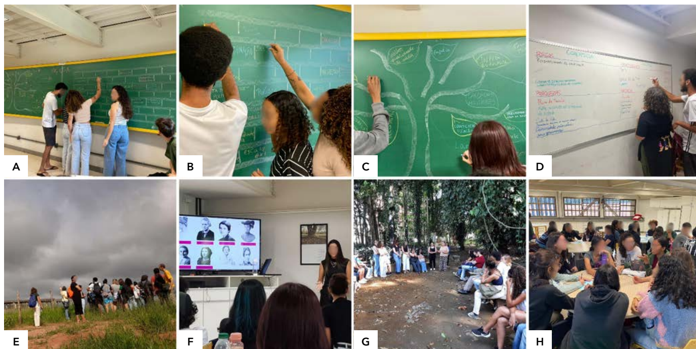
Figura 2. Atividades pedagógicas realizadas na disciplina, ao longo do período letivo

DESCRIÇÃO DA IMAGEM: Muro das Lamentações (A e B), Árvore dos Sonhos (C), Matriz FOFA (Fortalezas-Oportunidades-Fragilidades-Ameaças) (D), Estudo do Meio (E), Rodas de Conversa com coordenadoras de projetos em andamento (F e G) e preparação do projeto de extensão (H).