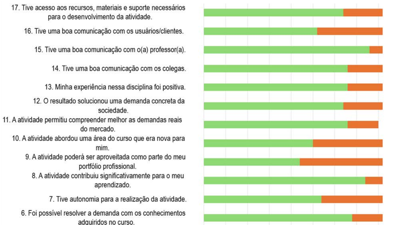
Gráfico 2. Respostas somadas da Terceira parte do questionário

Ainda, três projetos tiveram maior frequência de avaliações negativas: Stand de Expressão Gráfica para a Feira de Profissões (Universo UFPR) – Produção de Evento Extensionista I (2025); Redesign da Logomarca do Museu de Ciências Geodésicas e Cartográficas – Composição II (2023); e Redesign da Logomarca da ABEC-PR – Composição II (2024). As respostas oscilaram entre positivas e negativas, sem unanimidade negativa. A ambivalência sugere insatisfação potencialmente ligada ao tipo de projeto, à condução da disciplina ou ao desalinhamento com os interesses dos estudantes. A percepção docente também indica a necessidade de ajustes na atividade extensionista dessas disciplinas. Essa necessidade de ajustes e a preocupação com a forma de mensuração das atividades encontram eco em Braga et al. (2026), que alertam para a importância de não limitar a extensão à simples inclusão de créditos curriculares sem um impacto social e pedagógico claro.