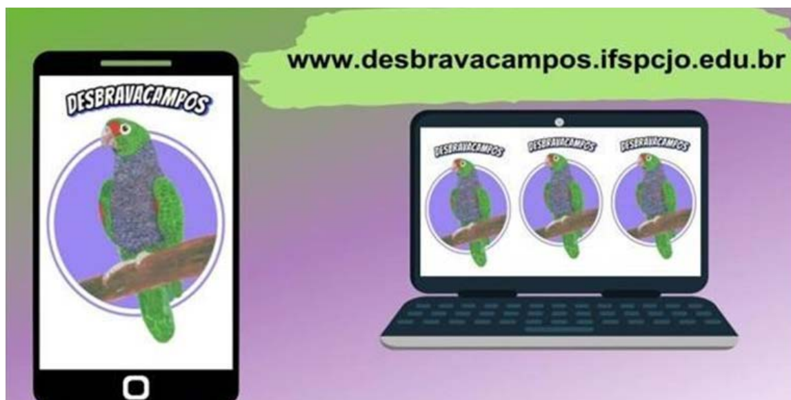
Tabela 2. Avatar Símbolo do Projeto

Fonte: Acervo das autoras. Avatar criado pela artista local Tamyres Prado Bertancelo