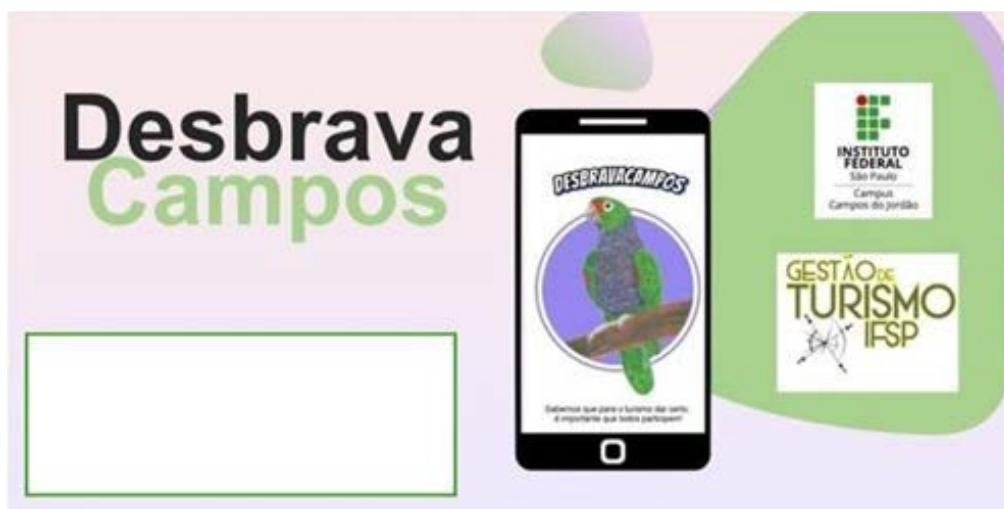
Tabela 2. Apresentação do DesbravaCampos